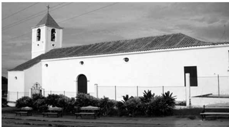
Figura 1. Vista lateral de la Iglesia Católica “San Pedro y San Pablo” de Corralillo.

El archivo se encuentra enclavado en el poblado de Corralillo de la Provincia de Villa Clara. La institución está localizada dentro de la Casa Parroquial de la Iglesia Católica “San Pedro y San Pablo”. La iglesia se encuentra ubicada en el centro de la manzana que rodean las calles Leoncio Vidal, Libertad, Rafael Izquierdo y Máximo Gómez. La edificación es considerada Patrimonio Local, posee una estructura de planta rectangular, presenta una sola puerta en su fachada principal la cual está presidida por tres arcos de medio punto de alto puntal en sus caras exteriores que soportan la torre, a la cual le siguen dos cuerpos cúbicos de forma decreciente y termina en una cupulilla de forma piramidal. La cubierta es de tejas criollas sobre un afaldaje de madera a dos aguas. Los muros son de mampostería utilizando fundamentalmente la piedra, el ladrillo y el cóc como material aglomerante. En el piso se utilizó el mosaico mezclado con el hormigón natural. La construcción data de la segunda mitad del siglo XIX. Fue inaugurada en febrero de 1853. Mantiene buen estado constructivo y sin peligro de derrumbe.