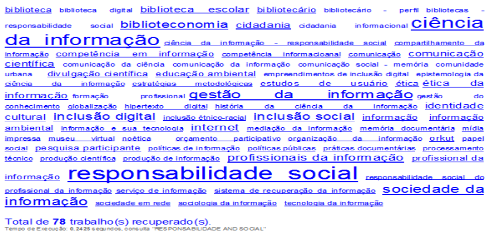
Figura 2 – Tags associadas aos resultados de busca

A seguir, apresentamos uma imagem do quadro de tags (Termos associados à descrição de busca para filtrar informações relevantes) da Brapci relativo aos resultados da busca usando o termo <responsabilidade AND social>, em todos os campos e em todo o período (1970-2013):