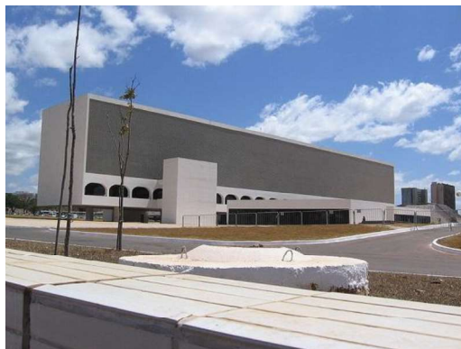
FIGURA 3 – Biblioteca Nacional Leonel de Moura Brizola, em Brasília.

Projeto arquitetônico de Oscar Niemeyer. Obra entregue inacabada em 2006.