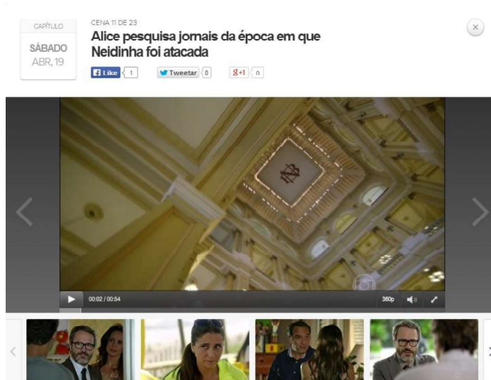
FIGURA 1 – Printscreen de cena da novela “Em Família”

No hotsite de visualização dos capítulos da novela, na exibição da cena 11 é possível identificar a claraboia do hall central da Biblioteca Nacional coberta pela lona.