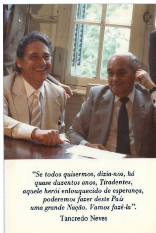
Figura 3. Santinho. Acervo Presidente F. H. Cardoso

O documento a seguir representa uma amostra de outra ambiguidade comum aos arquivos pessoais (Figura 3). O termo “santinho” pode corresponder à imagem de um santo, indicando principalmente uma prática religiosa, mas pode ser igualmente usado para um “prospecto de propaganda eleitoral, com retrato e um número de candidato a cargo público” (CAMARGO, 2015, p. 24).