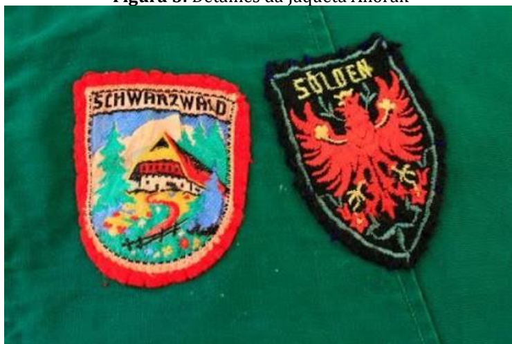
Figura 5: Detalhes da Jaqueta Anorak