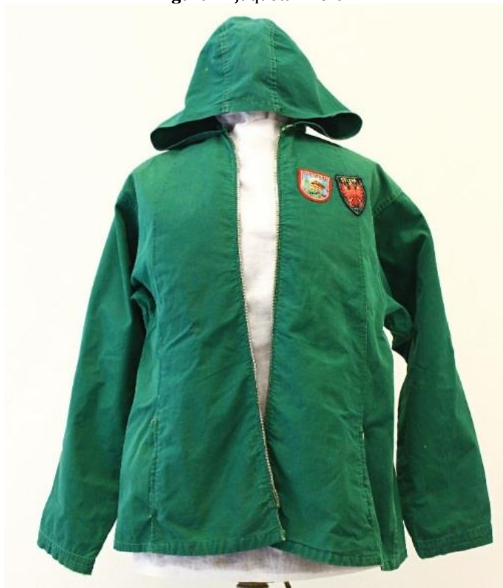
Figura 4: Jaqueta Anorak