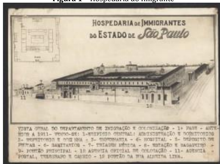
Figura 1 – Hospedaria do Imigrante

Para Machado, Alves e Fortim (2014), durante o século XIX e XX, migrantes de países sul-americanos vieram para São Paulo, desembarcaram no porto de Santos e seguiram de trem para cidade de Jundiaí; com a chegada dos trilhos do trem da São Paulo Railway à capital, a estação do Brás foi inaugurada no ano de 1867. As autoridades perceberam que havia a necessidade de construir um local que recebesse essas pessoas, justificando a fundação da Hospedaria de Imigrantes.