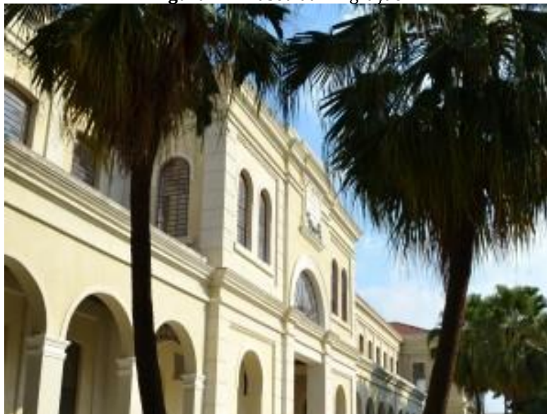
Figura 2 – Museu da Imigração

Segundo o site do Governo do Estado de São Paulo ([2016a]), no ano de 1982, o conjunto arquitetônico que constituía a Hospedaria foi tombado pelo Conselho de Defesa do Patrimônio Histórico, Arqueológico, Artístico e Turístico (CDPHAAT). Em 1993, foi criado o Museu da Imigração, que passou a administrar o acervo do Centro Histórico do Imigrante. Depois de 17 anos de funcionamento suas atividades foram cessadas para restauração do prédio. Sua reinauguração ocorre quatro anos depois, em 2014, e passa a ser denominado Museu da Imigração do Estado de São Paulo (MI).